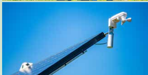
Suntracker 4000R freistehend